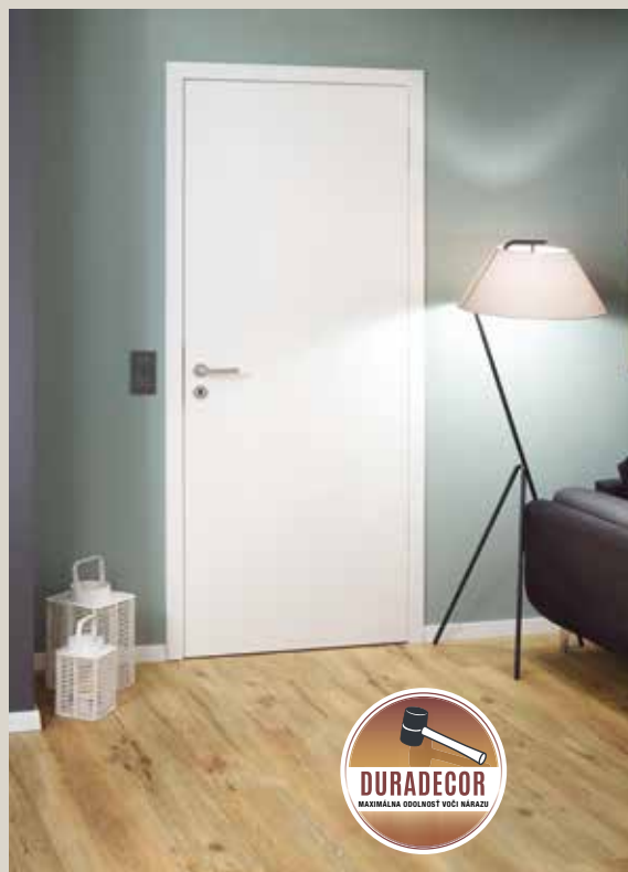
Obrázok: Interiérové dvere s bezfalcovým krídlom dverí, skryto umiestnenými závesmi a s povrchom Duradecor vo farbe RAL 9016 biely lak