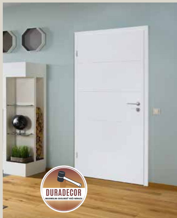
Obrázok: Interiérové dvere s falcovaným krídlom dverí s vyrazenými drážkami, povrch Duradecor biely lak RAL 9016